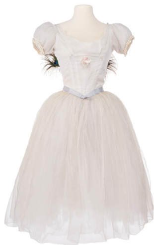
Costume de Michel Fresnay d'après Eugène Lami pour La Sylphide , 1972