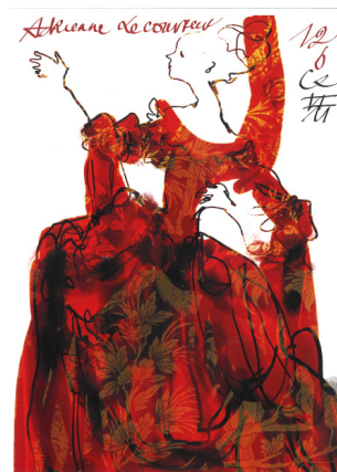
Maquette : Dessin de Christian Lacroix pour un costume dans Adriana Lecouvreur , 2012

Lorsque le spectacle n'est plus joué, il est dit «déclassé». Certains costumes d'intérêts artistiques et historiques intègrent alors les collections du CNCS comme œuvre patrimoniale et ne seront plus jamais portés. Les costumes au CNCS sont conservés et exposés précieusement avec une attention toute particulière.