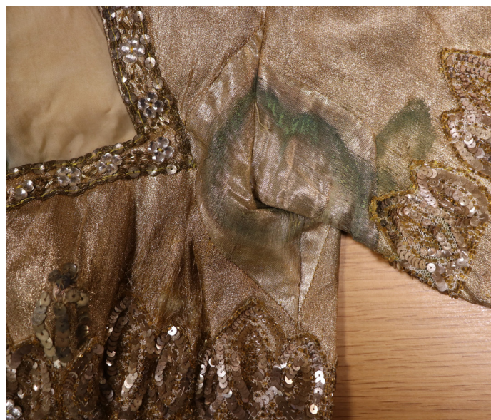
Altération due à l'eau

Des matériaux « neutres », non acides pour ne pas interférer avec les œuvres sont utilisés en réserves ou en exposition pour les mises en volume, comme interfaces entre les objets et leurs supports ou en protection de la lumière ou de l'empoussièrement. Par exemple le papier de soie, papier PH neutre pour la mise en forme, le conditionnement et l'emballage.