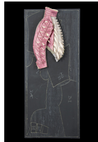
Accessoire de scène de Virginie Merlin pour La Mégère apprivoisée , 2007

Le décor de la pièce reconstitue un atelier de costumes où les comédiens possèdent chacun une planche sur laquelle est plaqué le costume de leur personnage.