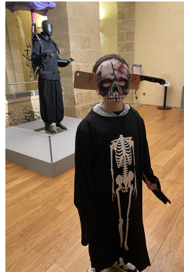
Déguisement Halloween 2023

Vêtement pour travestir une personne de telle sorte qu'il soit difficile de la reconnaître, afin de dissimuler, masquer sous certaines apparences, contrefaire pour tromper.