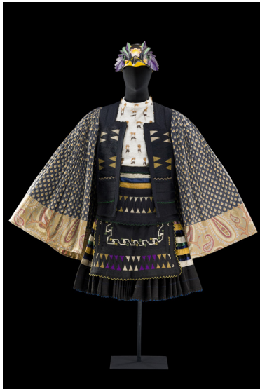
Costume de Jacques Schmidt et Emmanuel Peduzzi pour Les Oiseaux , 1985

Manière de se vêtir conforme à la coutume, à la tradition d'une époque ou d'un pays, d'un métier. Le mot s'est popularisé pour désigner un habillement d'apparat, vêtement de cérémonie, un vêtement porté par les acteurs au cours d'une représentation, puis un vêtement coordonné de la vie de tous les jours.