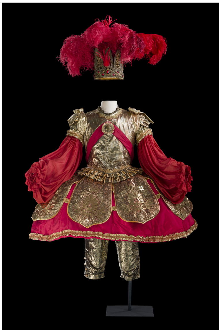
Costume de William Orlandi pour Manon , 1997