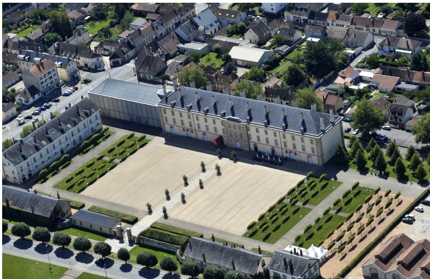
Le Centre national du costume et de la scène au Quartier Villars, Moulins (Allier)

En cliquant sur le lien, retrouvez la fiche associée.