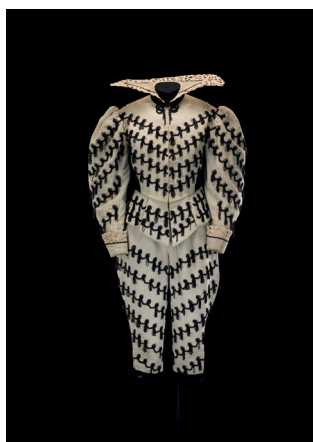
Costume de Christian Bérard pour Dom Juan ou Le Festin de Pierre , 1947

Coll. CNCS / Don de la compagnie de L'Illustre-Théâtre