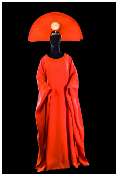
Costume de Kenzo Takada pour La Flûte enchantée, 1999

La comédie musicale entrelace les histoires de plusieurs contes de fées des frères Grimm. Les personnages principaux sont tirés du Petit Chaperon rouge , de Jack et le Haricot magique , Raiponce , et Cendrillon . Tous ces personnages sont liés ensemble dans une histoire originale impliquant un boulanger, sa femme et leur désir de vouloir fonder une famille et une sorcière qui a jeté un sort sur eux. Pour annuler le sort, le boulanger et sa femme vont devoir rapporter plusieurs objets à la sorcière (une vache blanche, une cape rouge...).