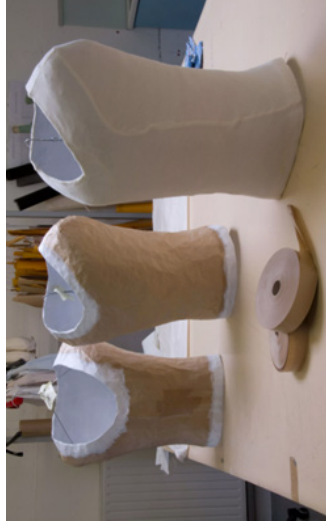
Exemples de mannequins sur mesure réalisés au CNCS

Sur la deuxième, quelles précautions le conservateur semble-t-il prendre avec le costume ?