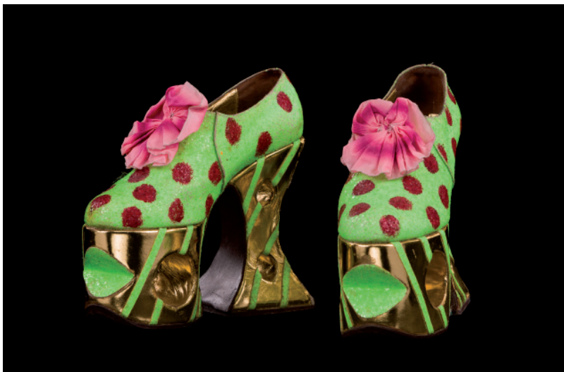
Chaussures de Françoise Tournafond pour Nini , 1995