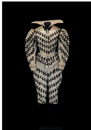
Costume de Christian Bérard pour Dom Juan ou Le Festin de Pierre 1947, actes IV et V