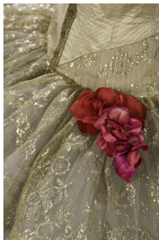
Costume pour Grand Pas classique