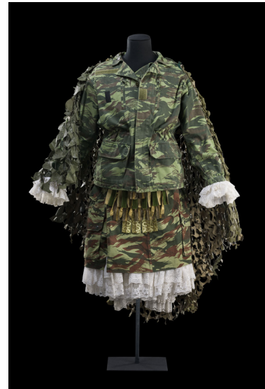
Costume de Michel Dussarrat pour El burgués tropical , 1998

Dans ce Bourgeois gentilhomme revu avec humour par Jérôme Savary, le costumier Michel Dussarrat joue avec les codes du costume historique du 17 e siècle et l'uniforme militaire porté par les guérilleros de la révolution cubaine.