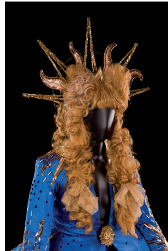
Perruque de Michel Dussarrat pour Y a d'la joie ! ... et d'amour, 1997