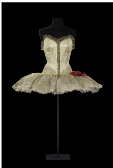
Costume pour Grand Pas classique