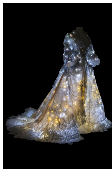
Costume d'Alain Blanchot pour Cendrillon , 2011

Coll. CNCS / Don Ville de Saint-Etienne-Opéra, Théâtre national de l'Opéra-Comique et Théâtres de la ville de Luxembourg