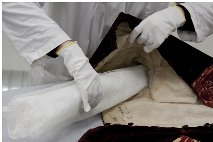
Vue des réserves, conditionnement

Le travail de mannequinage disparaît au profit de l'évocation du personnage, de l'interprète ou de l'intention artistique originelle en s'inscrivant dans un contexte historique, patrimonial et sociétal.