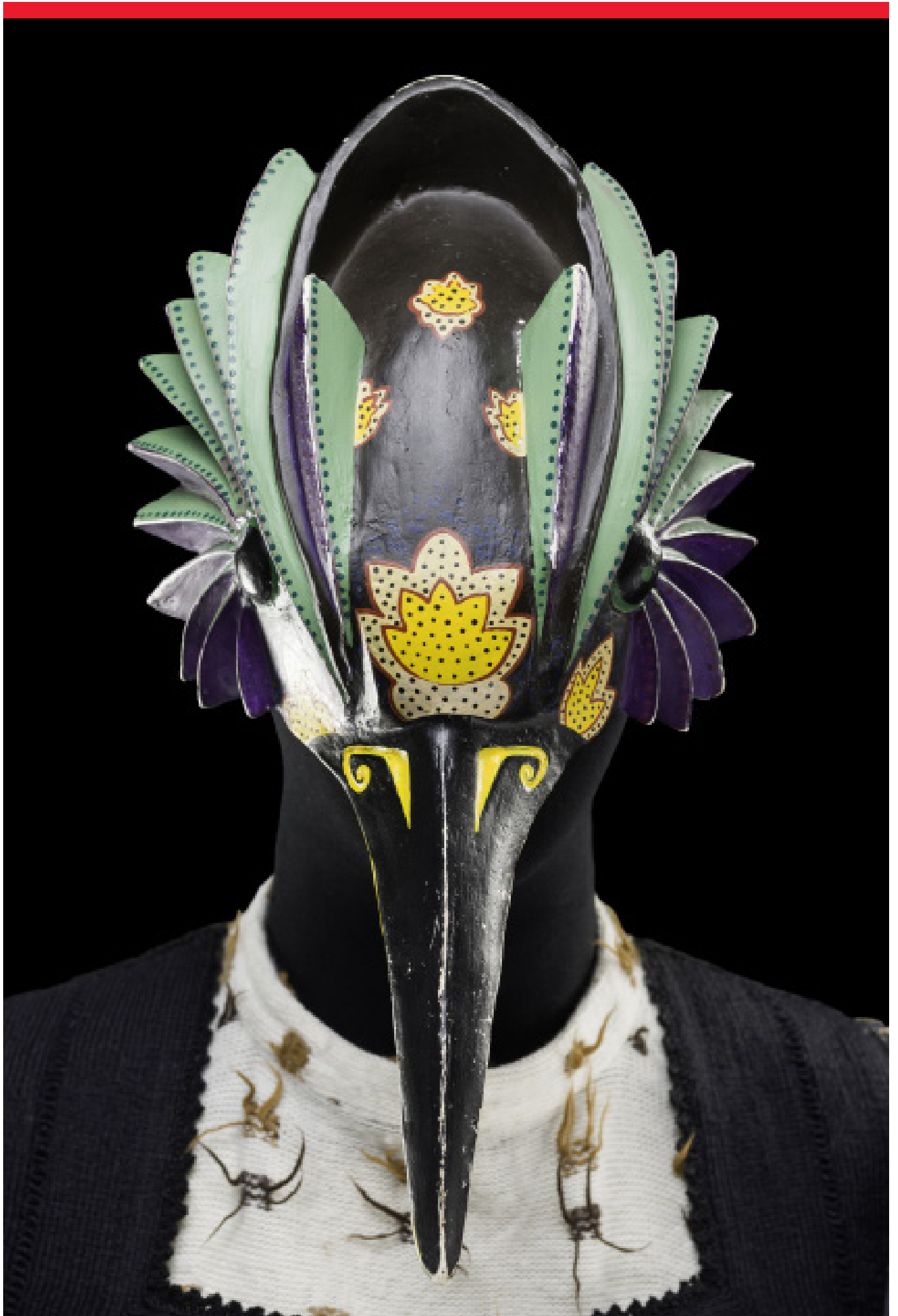
Costume de Jacques Schmidt et Emmanuel Peduzzi pour Les Oiseaux , 1985