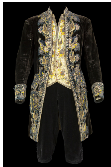
Vêtement du 18 e siècle réutilisé dans Le Mariage de Figaro , 1946

Histoire – E.M.C. – Lettres – Humanités, Littérature, Philosophie, Langues vivantes