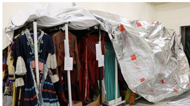
Traitement des costumes par « anoxie »