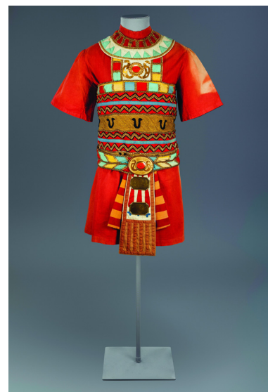
Costume d'Eugène Lacoste pour Aida , 1880