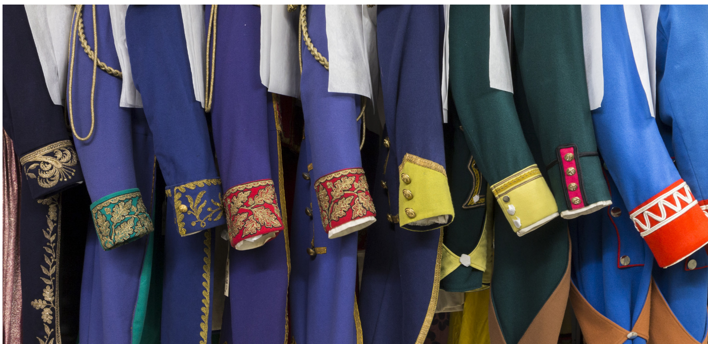
Vue des réserves

Ces salles dévoilent quelques-uns des Trésors issus des 10 000 costumes soigneusement conservés par le musée. La nature et la fragilité des textiles ne permettent pas leur exposition de manière permanente. C'est pourquoi les costumes exposés sont fréquemment renouvelés selon différentes approches thématiques ou historiques.