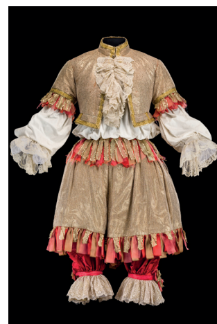
Costume de Patrice Cauchetier pour Dom Juan ou Le Festin de Pierre , 2008 © CNCS / Florent Giffard

Dans l'œuvre de Molière, Sganarelle décrit le costume de Dom Juan comme : «... un habit bien doré et des rubans couleur de feu » Acte I, scène 2.