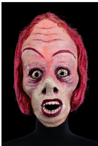
Masque de Cécile Kretschmar pour Minetti, 2002