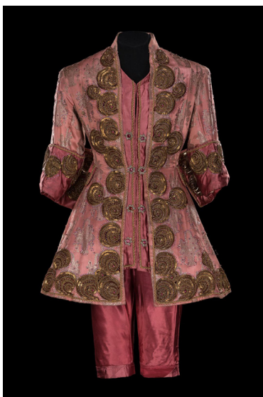
Costume pour Monsieur Beaucaire, v.1950.1570

Les années 1960 et 1970 voient la prééminence du metteur en scène qui impose sa vision. Le métier de créateur de costumes s'émanche grâce à la création de cursus d'études et de formations diplômantes. Depuis les années 1970, de nouveaux matériaux, parfois éphémères, ou de nouvelles technologies sont développés par les ateliers pour participer à l'illusion du costume et à la magie de la scène.