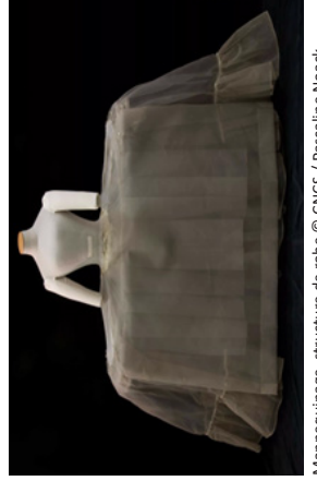
Mannequinage, structure de robe