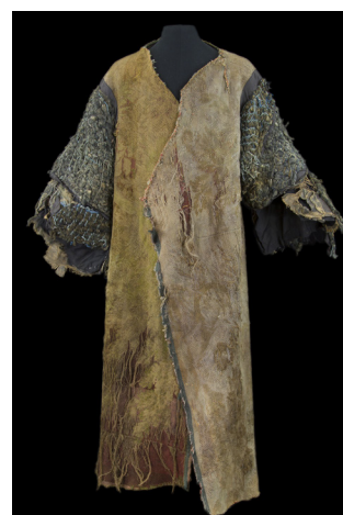
Costume de Geneviève Sevin-Doering pour Le Roi Lear , 1967

Ce costume est le premier exemple de l'innovation technique créée par Geneviève Sevin-Doering : la coupe en un seul morceau. Ses réflexions la portent sur une nouvelle approche de l'équilibre et de l'aplomb du vêtement en lien avec la dynamique naturelle du corps.