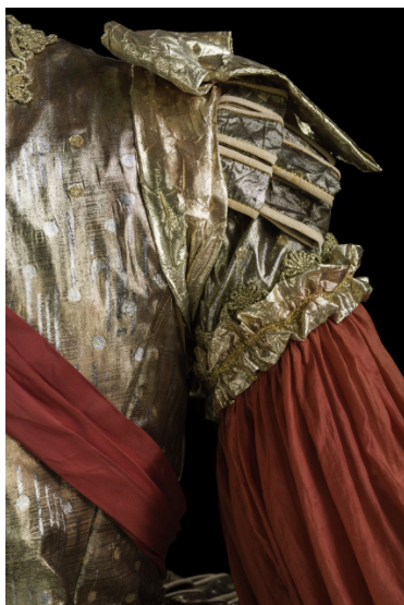
Costume de William Orlandi pour Manon , 1997