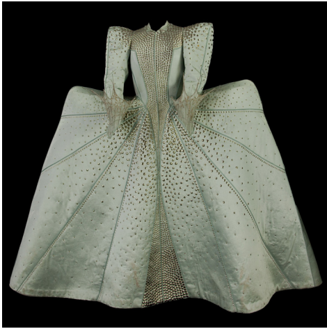
Costume de Thierry Mugler pour La Tragédie de Macbeth , 1985