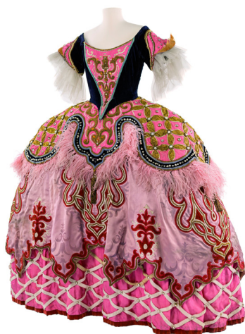
Costume de Georges Wakhévitch pour Les Indes galantes , 1952