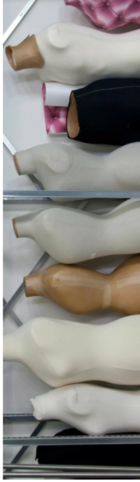
Différents modèles de mannequins dans les réserves du CNCS

Il s'agit de trouver l'adaptation la plus parfaite du support de présentation aux formes et à la silhouette de celui ou celle qui a porté le costume. Illustrant les intentions du costumier et le rendu sur scène, la documentation iconographique (maquettes, photographies...) est précieuse pour la bonne réalisation de toutes ces opérations.