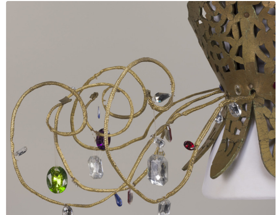
Robe lustre de Philippe Guillotel pour Petites pièces montées , Espace Malraux - Scène Nationale de Chambéry, 1993. Prêt Compagnie DCA.