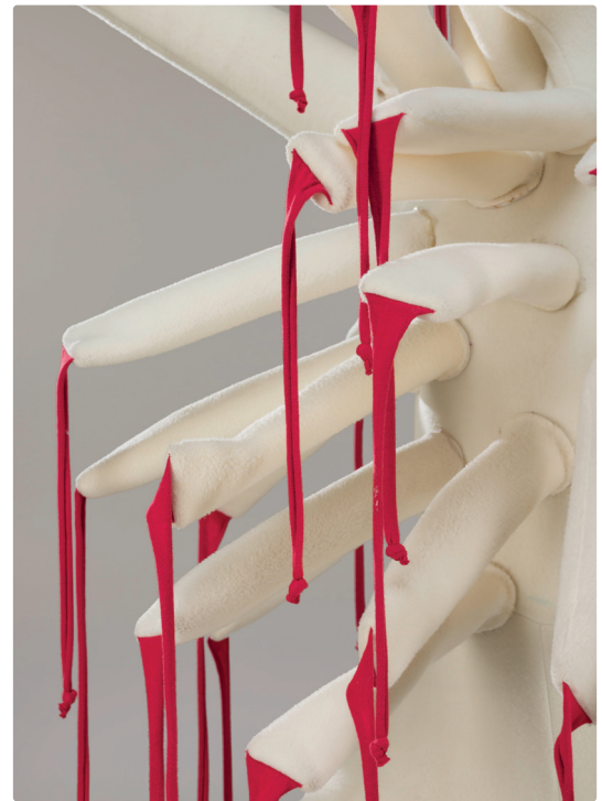
Costume de microbe de Philippe Guillotel porté lors de la cérémonie d'ouverture des Jeux olympiques d'hiver, Albertville, 1992. Coll. CNCSS / dépôt de la Bibliothèque nationale de France.

Présence indispensable du groupe entre 15 à 30 mn avant chaque prestation à évaluer selon les besoins (âge typologie public, distance de déplacement). En cas de retard, le musée se réserve le droit d'écourter l'activité ou de l'annuler si le retard est trop important.