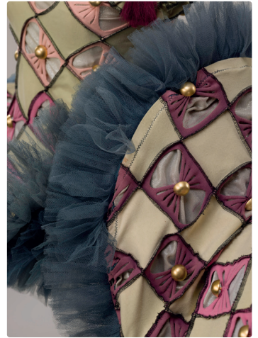
Les siamoises par Catherine Coustère pour Triton 2TER, opération Triton et les petites tritures, Franc-Moisin, 1999. Prêt Compagnie DCA.