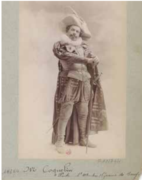
M. Coquelin. Porte Saint- Martin. Cyrano de Bergerac : [photographie, tirage de démonstration] / [Atelier Nadar] - Source gallica.bnf.fr / Bibliothèque nationale de France