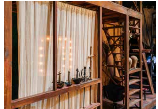
Détail du décor de Cyrano de Bergerac par Éric Ruf, Comédie-Française, Paris, 2006.

https://cnscs.fr/profil/visite-groupe-scolaire/