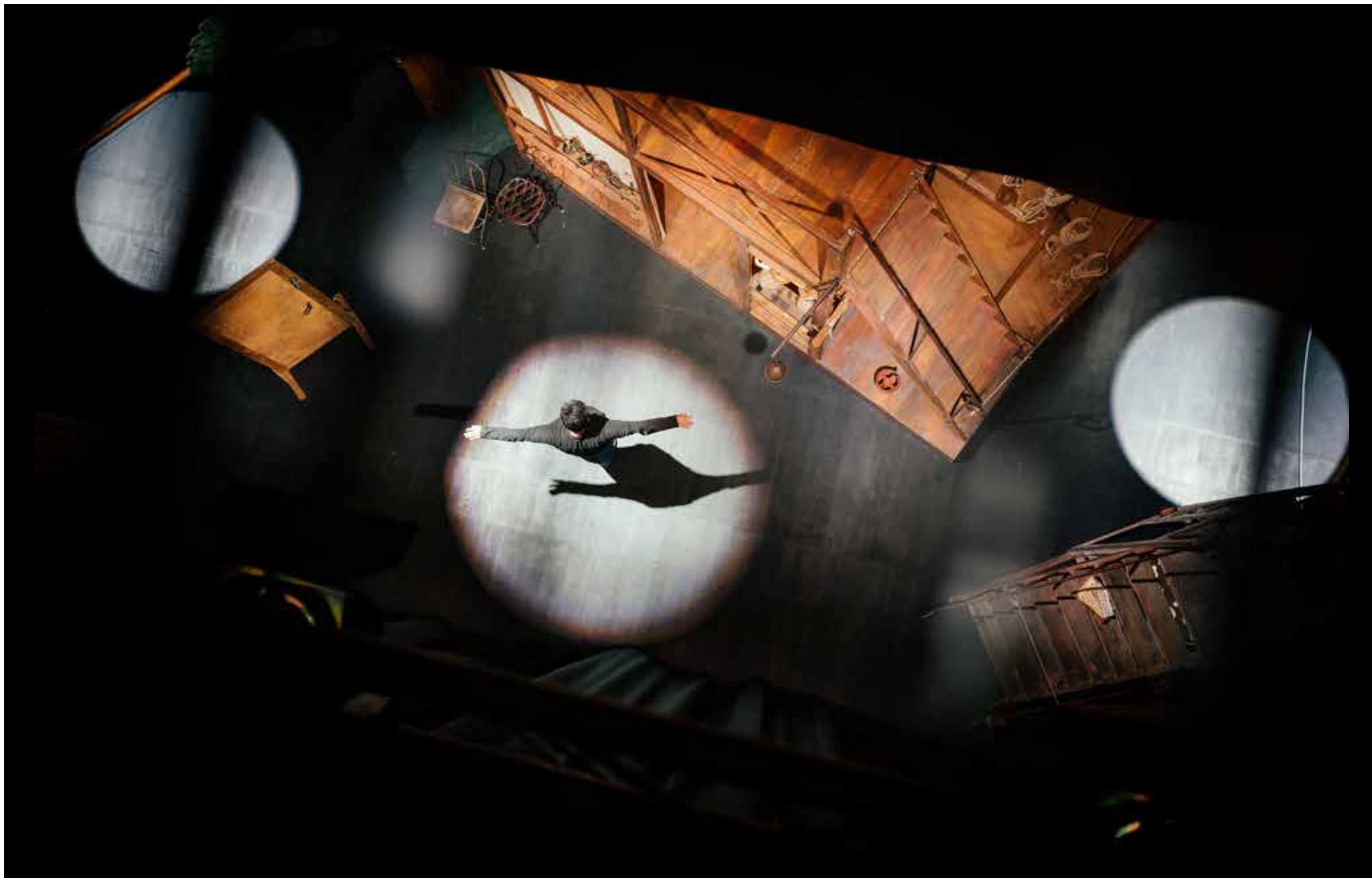
Éléments de décors de Cyrano de Bergerac par Éric Ruf, Comédie-Française, Paris, 2006. © Nicolas Anglade