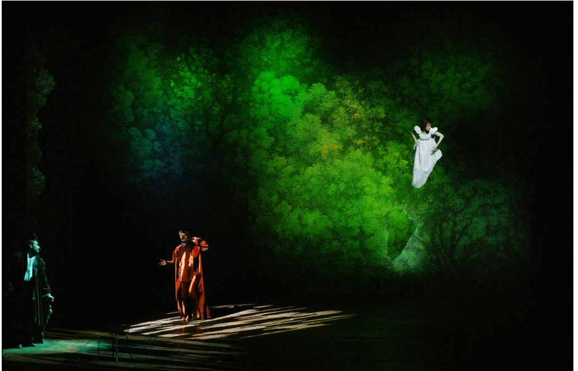
Cyrano de Bergerac par Éric Ruf, Comédie-Française, Paris, 2006