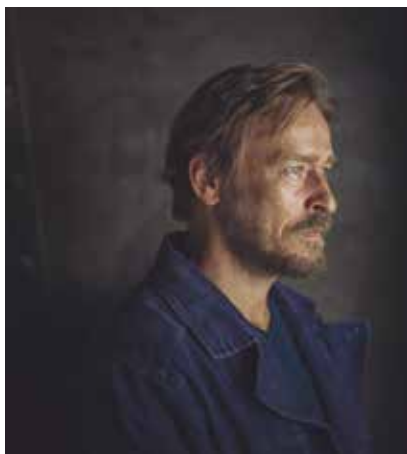
Éric Ruf administrateur Comédie-Française

La Comédie-Française compte trois salles : la Salle Richelieu, le théâtre du Vieux-Colombier et le Studio-Théâtre.