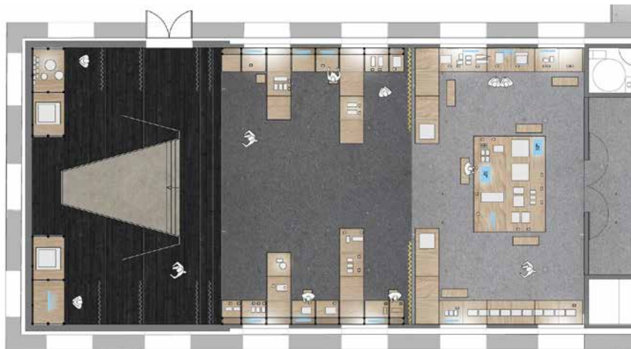
Avant-projet La Scène © ATELIERS ADELIN RISPAL, architectes scénographes

Dans une approche pédagogique et immersive, les différents savoir-faire se conjuguent pour donner vie à une scénographie. De nombreux objets - croquis, dessins, maquettes de décors en volume, plans, accessoires, outils, échantillons de matériaux divers, extraits et entretiens audiovisuels - en provenance d'institutions ou de compagnies théâtrales, de maisons d'opéras, nationales ou en région, d'écoles de formation, donnent les clés de compréhension et de découvertes de ces métiers peu connus du public. Pour rendre encore plus sensible la découverte de ce qui compose la scénographie d'un spectacle, un focus sur une création théâtrale est ici présentée grâce à la collaboration de la Comédie-Française. Éric Ruf , administrateur de la Comédie-Française et scénographe, a accepté de présenter son travail pour la pièce d'Edmond Rostand, Cyrano de Bergerac , mise en scène par Denis Podalydès à la Comédie-Française en 2006. Dans ce décor à taille réelle, le visiteur devient acteur et foule les planches d'une scène de théâtre et en découvre même les coulisses !