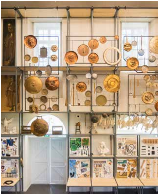
Accessoires et éléments de fabrication de la Comédie-Française

Il n'est pas nécessaire de maîtriser toutes les notions avant votre venue mais d'y être sensibilisées avec l'objectif d'inciter aux questionnements sur les grands thèmes rencontrés.