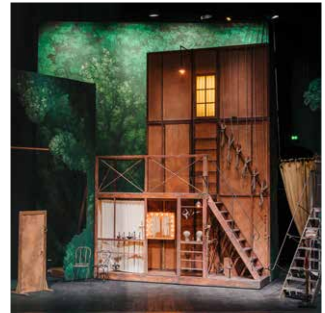
Éléments de décors de Cyrano de Bergerac par Éric Ruf, Comédie-Française, Paris, 2006 © Nicolas Anglade

Le visiteur est conduit par une voix enregistrée, donnant la terminologie et fonctionnement des éléments expliqués, tandis que des halos de lumière l'incitent à se déplacer et à diriger son regard au fil des explications.