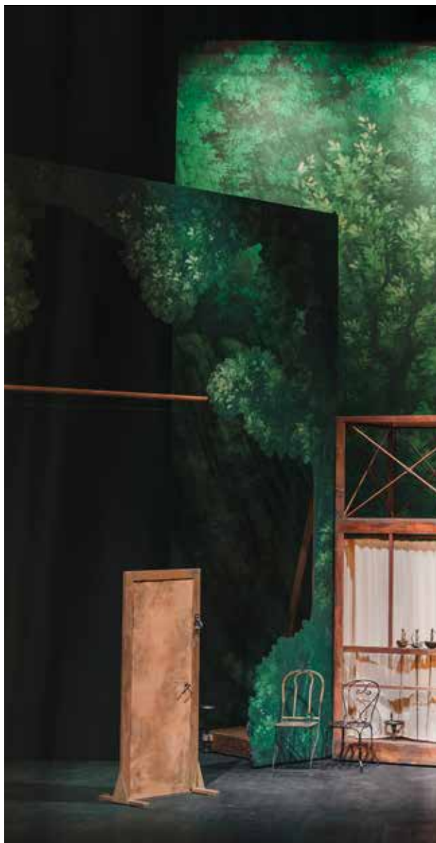
Détail du décor de Cyrano de Bergerac par Éric Ruf, Comédie-Française, Paris, 2006.