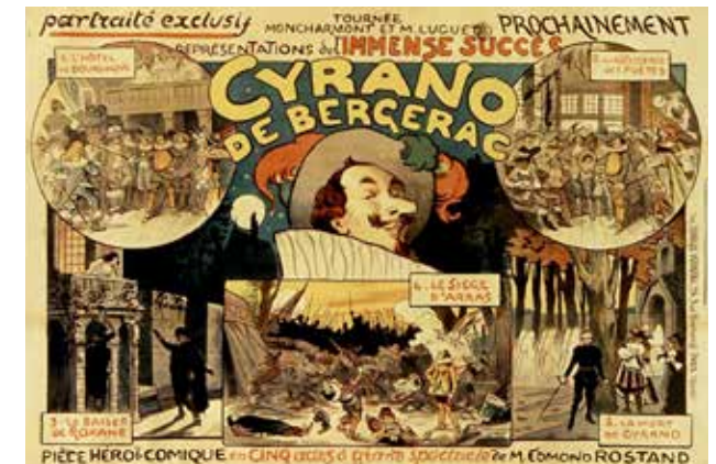
Tournée Moncharmont et M. Luguet, prochainement Cyrano de Bergerac : [affiche] / [Lucien-Marie-François Metivet]

Parmi ses œuvres, on trouve aussi Le Pédant joué , composé en 1645 ou 1646. Cette comédie en cinq actes et en prose est librement inspirée du Chandelier , de Giordano Bruno, dont une traduction est parue en 1633. C'est une comédie