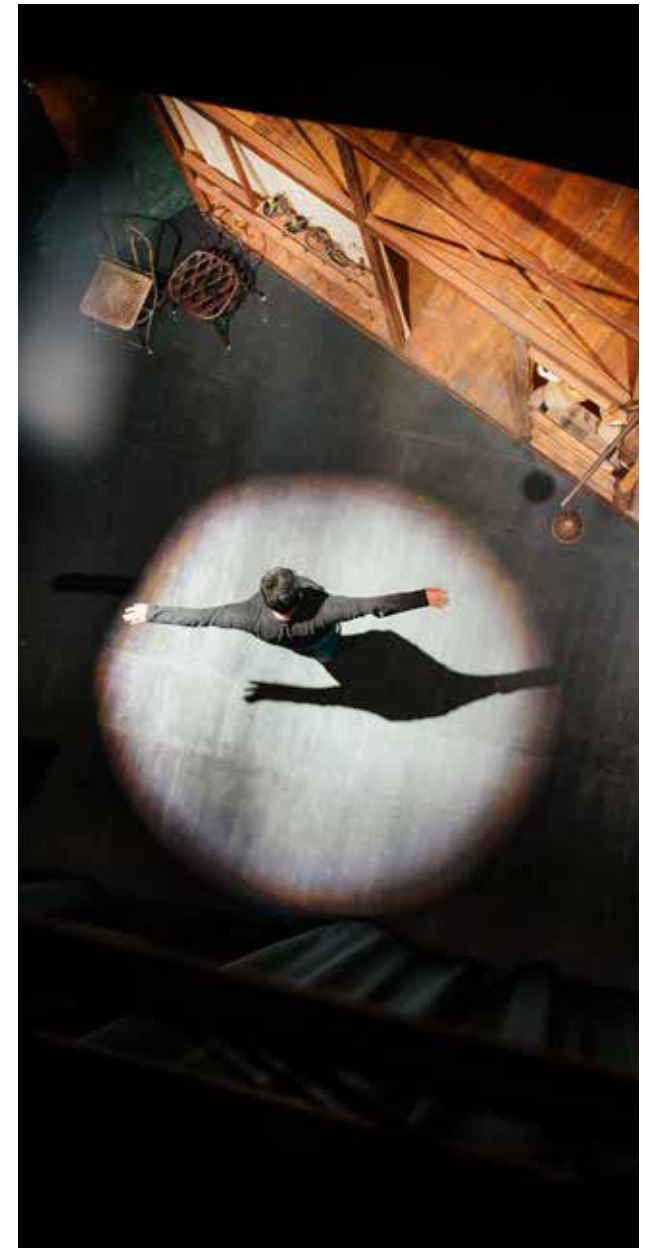
Éléments de décors de Cyrano de Bergerac , Comédie-Française, Paris, 2006.