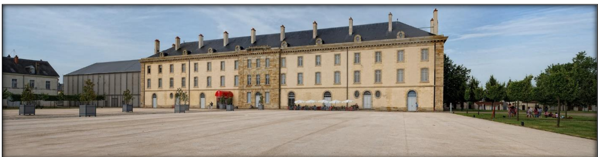
Le CNCS est situé dans une ancienne caserne de cavalerie du XVIII e siècle, classée Monument historique.

Ouverture tous les jours de 10h à 18h (18h30 en juillet et août)