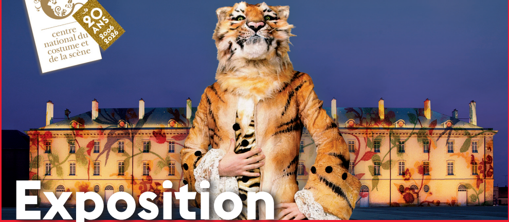
COSTUME DE JEAN-MARC TILMÉ POUR LE TIGRE DANS LA FÊTE ENCHANTEE, OPIÈRE DE MOUANT, OPERA NATIONAL DE PARIS, 2000. © CHRISTIAN LEBRE / OPN BATHMOT © JEAN-MARC TILMÉ / OPN BATHMOT. GAYRISSE / ATALANTE PARIS.