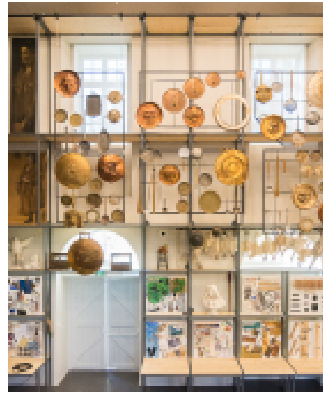
Accessoires et éléments de fabrication de la Comédie-Française

Il n'est pas nécessaire de maîtriser toutes les notions avant votre venue mais d'y être sensibilisées avec l'objectif d'inciter aux questionnements sur les grands thèmes rencontrés.