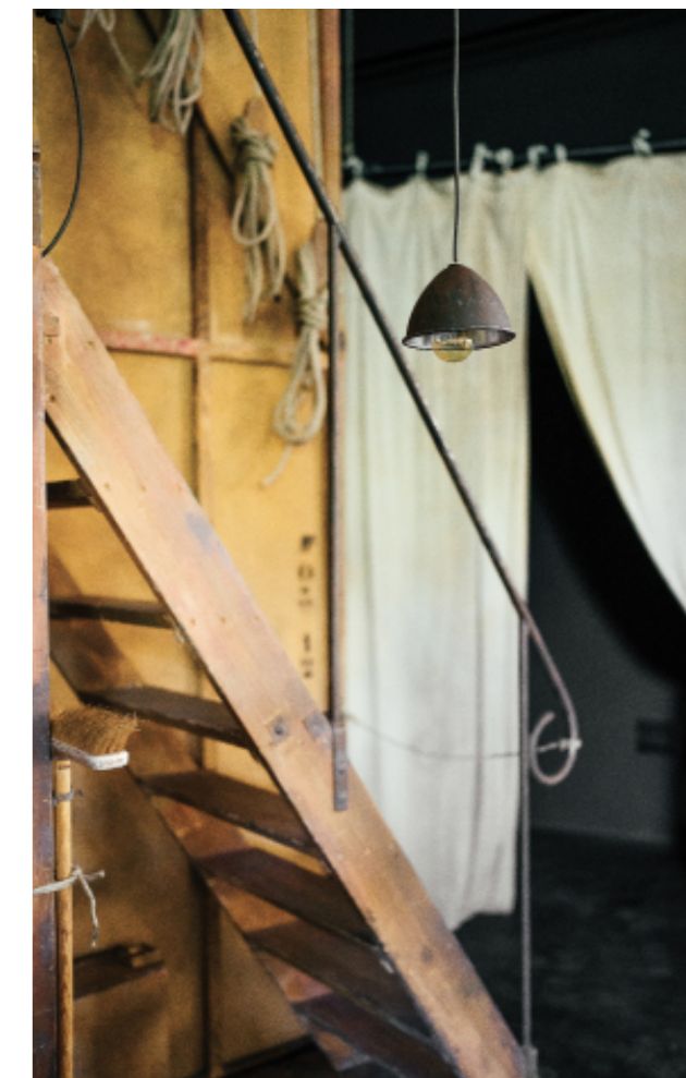
Détail du décor de Cyrano de Bergerac par Éric Ruf, Comédie-Française, Paris, 2006.

Français – Langues vivantes – Histoire des Arts – Arts plastiques