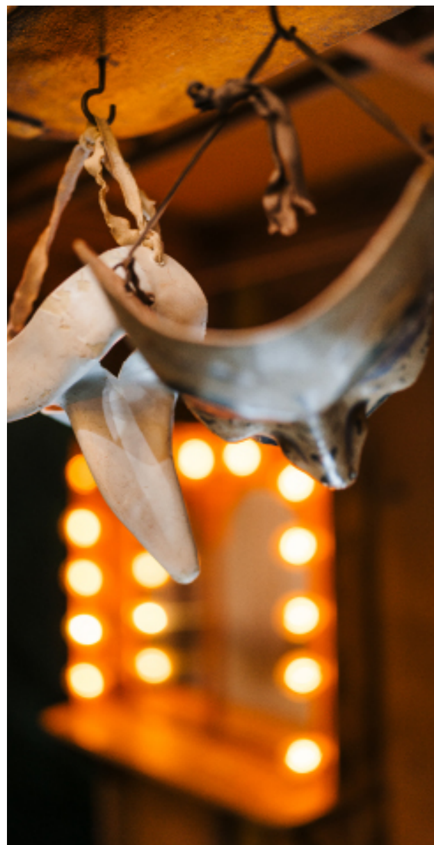
Détail du décor de Cyrano de Bergerac par Éric Ruf, Comédie-Française, Paris, 2006 Informations pratiques I p.24