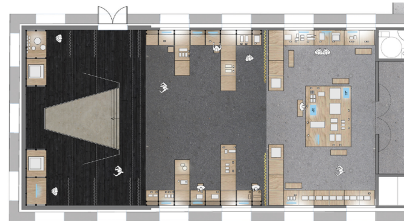
Avant-projet La Scène © ATELIERS ADELIN RISPAL, architectes scénographes

ACTE III | La représentation grâce à une scène équipée d'un plateau, de cintres, de rideaux et d'éléments de décors.