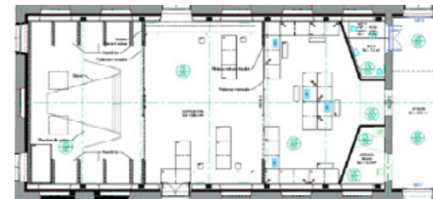
ACTE III ACTE II ACTE I Atrium

Laissez-vous porter par l'accompagnement des médiateurs du CNCS et veillez à l'attention et l'encadrement du groupe pour qu'il profite au mieux des explications.