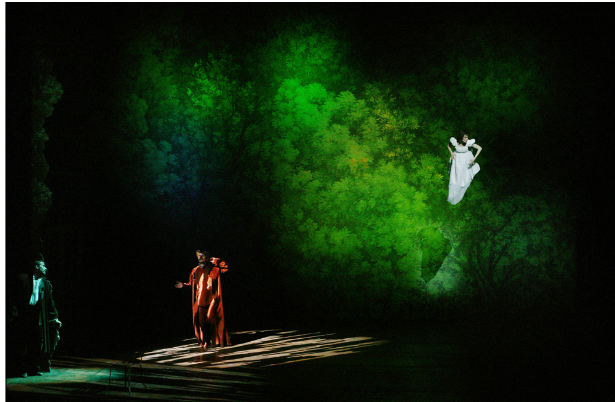
Cyrano de Bergerac par Éric Ruf, Comédie-Française, Paris, 2006

La mise en scène est en effet particulièrement sensible à l'éloge que Rostand fait du théâtre et de l'art des acteurs dans Cyrano de Bergerac . Le personnage principal, au-delà des caractéristiques qu'on lui connaît (éloquence et ardeur guerrière, sagesse de philosophe et orgueil excessif, sentimentalisme et abnégation) est avant tout un être de théâtre, tout entier fait de mots et de gestes, et tout à la fois acteur et metteur en scène. L'enjeu de la scène du balcon est aussi de faire accepter à Christian ce théâtre auquel il refuse d'appartenir : Cyrano lui souffle les mots comme à un acteur débutant, pour le plus grand plaisir de Roxane et du public. La figure de l'acteur est ainsi au centre du spectacle.