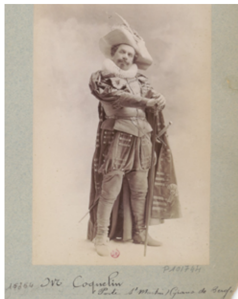
M. Coquelin. Porte Saint- Martin. Cyrano de Bergerac : [photographie, tirage de démonstration]