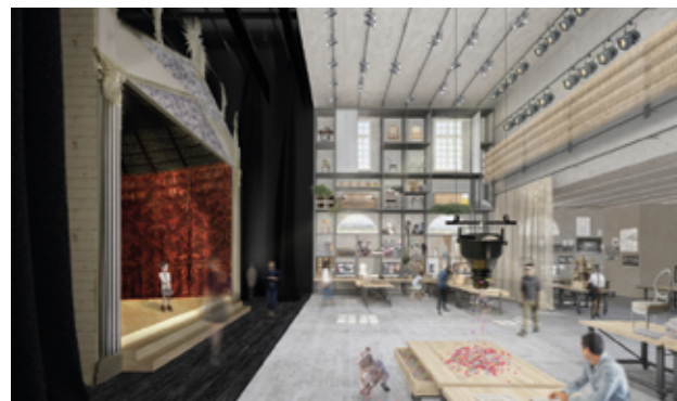
© ATELIERS ADELINE RISPAL, architectes scénographes

Ce deuxième acte montre le passage du projet artistique conçu par le scénographe à la concrétisation en volume, soit en d'autres termes, de la maquette à la réalisation du décor en trois dimensions.