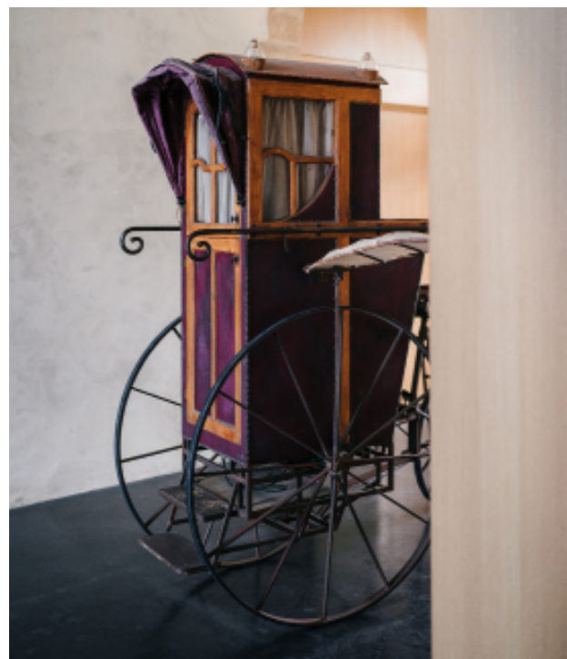
Détail du décor de Cyrano de Bergerac par Eric Ruf, Comédie-Française, Paris, 2006.