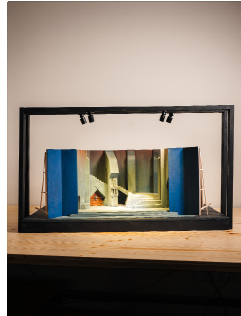
Hamlet, Théâtre de l'Avenue, Paris. Réalisé d'après la maquette originale de Gaston Baty conservée à la BnF