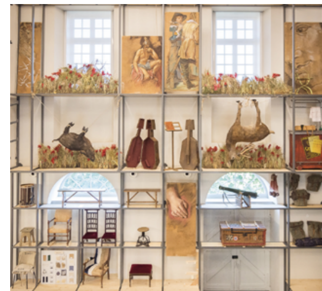
Accessoires de Cyrano de Bergerac , Comédie-Française, Paris 2006 © José Manuel Boissinot © ATELIERS ADELINE RISPAL, architectes scénographes

Au-delà de sa portée esthétique et dramaturgique, le décor doit permettre le jeu des interprètes, comédiens, chanteurs ou danseurs, en toute sécurité selon des normes qui encadrent ces dispositifs scéniques. Les contraintes sont d'autant plus importantes en cas de tournées dans différents lieux qui soumettent les éléments à de nombreuses manipulations.