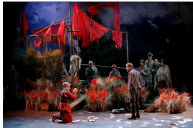
Cyrano de Bergerac par Éric Ruf, Comédie-Française, Paris, 2006