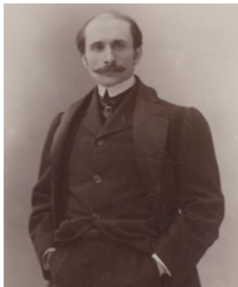
M. Rostand. Homme de lettres : [photographie, tirage de démonstration]

Cette pièce a la particularité de compter de très nombreux personnages d'horizons variés mettant en lumière entre autres des corps de métiers divers : bourgeois, marquis, mousquetaires, tire-laine, pâtisseries, poètes, cadets, Gascons, comédiens, pages, enfants, soldats espagnols, spectateurs, précieuses, religieuses, gardes, musiciens, etc.