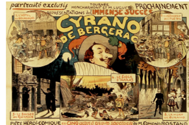
Tournée Moncharmont et M. Luguet, prochainement Cyrano de Bergerac : [affiche] / [Lucien-Marie-François Metivet]

Parmi ses œuvres, on trouve aussi Le Pédant joué , composé en 1645 ou 1646. Cette comédie en cinq actes et en prose est librement inspirée du Chandelier , de Giordano Bruno, dont une traduction est parue en 1633. C'est une comédie