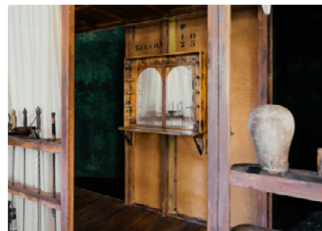
Détail du décor de Cyrano de Bergerac par Éric Ruf, Comédie-Française, Paris, 2006.

Français – Littérature et société – Histoire des Arts