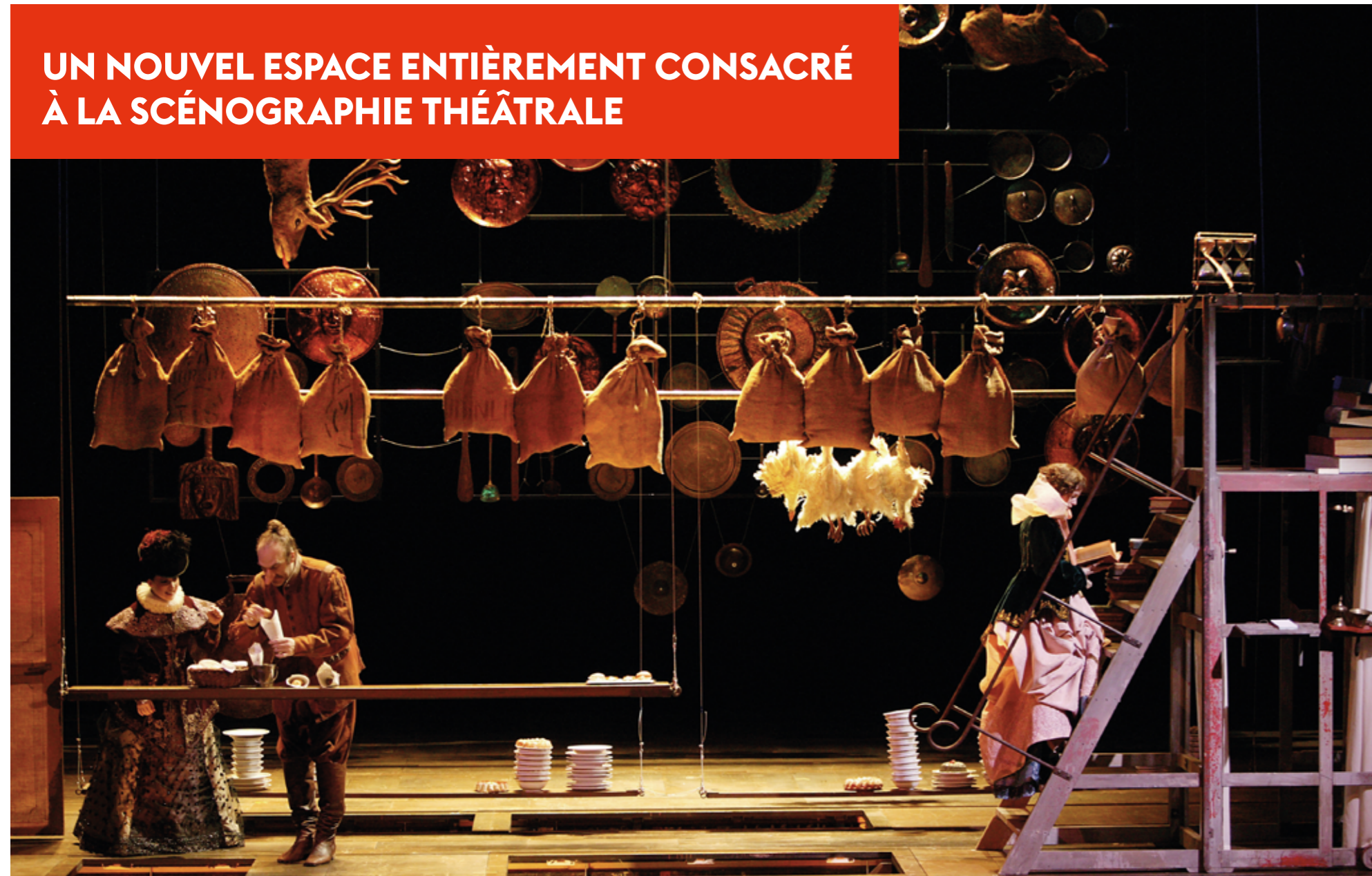
Cyrano de Bergerac par Éric Ruf, Comédie-Française, Paris, 2006