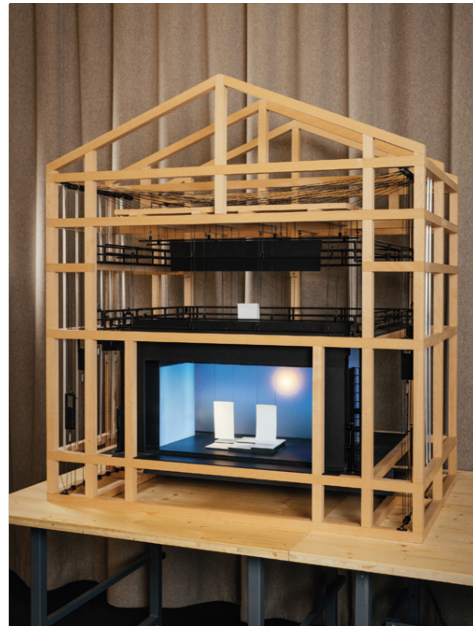
Maquette cage de scène conçue par REAS-PL. - Philippe Lacroix

Au cours des siècles, de nombreuses évolutions ont transformé la pratique de la scénographie, tant pour la représentation théâtrale que pour l'interaction avec les autres arts et les différents mouvements artistiques.