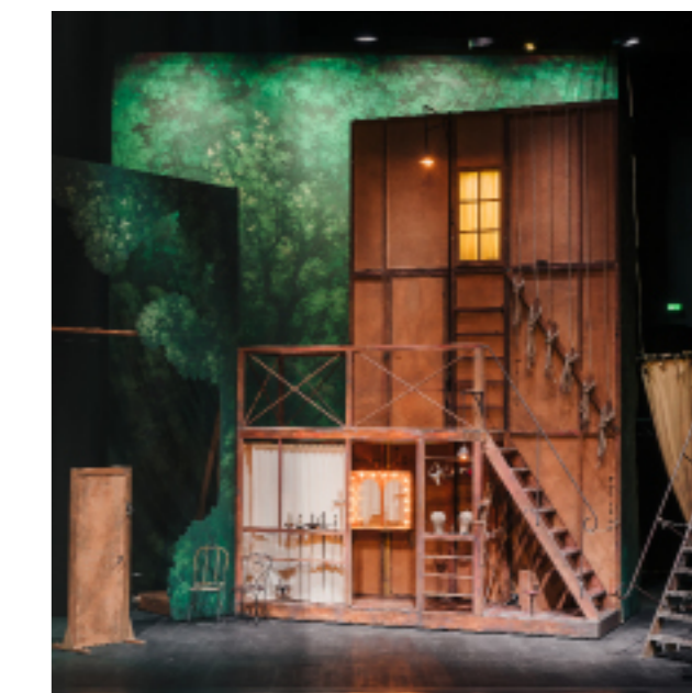
Éléments de décors de Cyrano de Bergerac par Éric Ruf, Comédie-Française, Paris, 2006