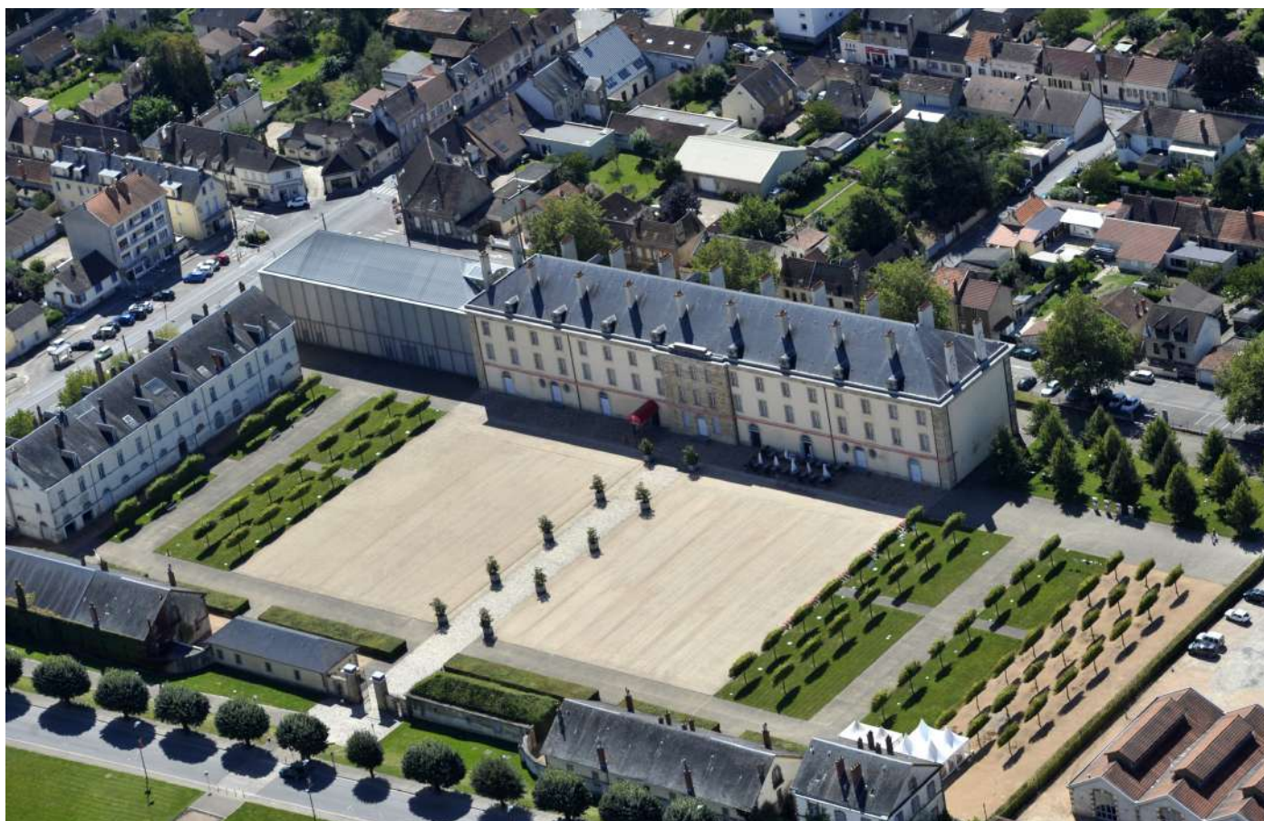
Le Centre national du costume et de la scène au Quartier Villars, Moulins (Allier)

En cliquant sur le lien, retrouvez la fiche associée.