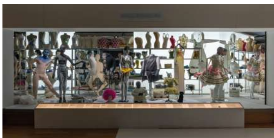
Exposition Tous en scène ! vitrine 3