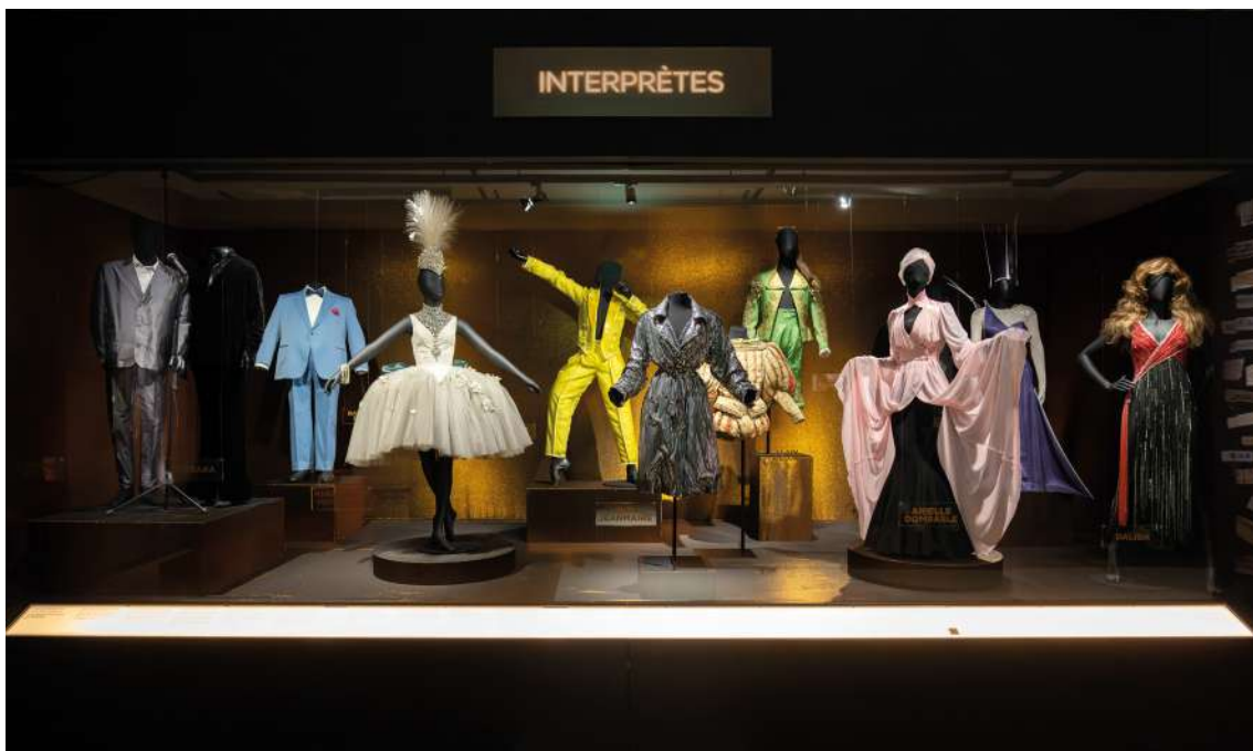
Exposition Tous en scène ! vitrine 9

> Sélection de costumes dans l'exposition