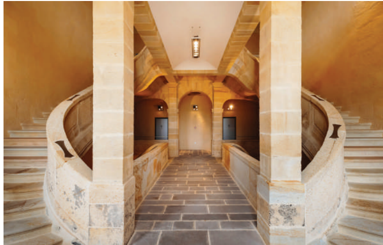
Les escaliers en pierre de Coulandon