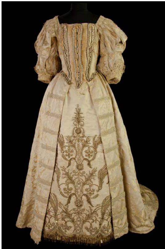
Costume porté par Sarah Bernhardt pour le rôle de la Reine dans Ruy Blas, pièce de Victor Hugo. Comédie-Française, 1879. Coll. CNCS / Comédie-Française

Certaines pièces de la collection du CNCS sont si fragiles qu'elles doivent être conservées à plat et exposées sous une lumière limitée. Parmi elles, le costume historique le plus précieux est celui de Sarah Bernhardt, porté dans le rôle de la reine d'Espagne dans Ruy Blas , artiste choisie par Victor Hugo en 1872. Bernhardt, surnommée « la Voix d'or » par Hugo et « Monstre sacré » par Jean Cocteau, est reconnue comme la plus grande tragédienne de la fin du 19 e et du début du 20 e siècle. Son talent et sa personnalité charismatique lui ont permis de laisser une empreinte indélébile dans le monde du théâtre avec des rôles emblématiques tels que Phèdre, Tosca et Jeanne d'Arc. Elle a mené une carrière exceptionnelle, tant en France qu'à l'étranger, captivant le public avec ses performances mémorables. Elle accordait une attention particulière à ses costumes de scène, souvent luxueux et inspirés de l'historicisme. Ces éléments témoignent de son engagement envers l'art théâtral et de son influence durable sur les générations futures.