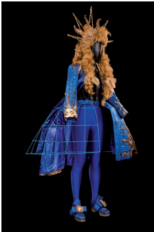
Costume de Michel Dussarrat pour le rôle du Soleil dans Y a d'la joie ! , spectacle de J. Savary. Opéra-Comique, Paris, 1980. Coll. CNCS / don Michel Dussarrat