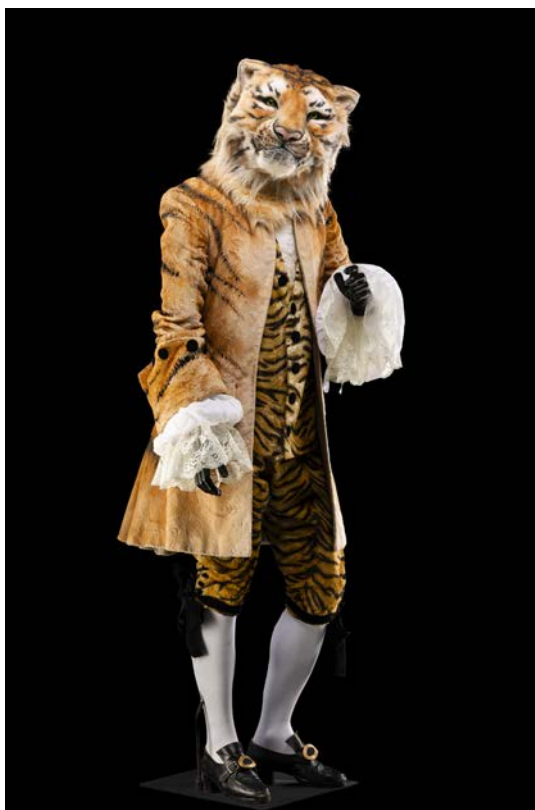
Costume de Jean-Marc Stehlé pour le Tigre dans La Flûte enchantée , opéra de Mozart. Opéra national de Paris, 2000. Coll. CNCS / dépôt de l'Opéra national de Paris

Depuis sa création, le Centre national du costume et de la scène (CNCS) s'est engagé à constituer une collection unique de costumes de scène, reflétant plus de deux siècles de spectacle vivant en France. Cette exposition permet de (re)découvrir une sélection d'acquisitions emblématiques. Les costumes proviennent de dépôts effectués par des institutions fondatrices telles que la Bibliothèque nationale de France, la Comédie-Française et l'Opéra national de Paris, et se sont enrichis grâce à des dons de théâtres, compagnies, artistes et particuliers, ainsi qu'à des achats ciblés. Au cours de ces vingt dernières années, le CNCS a mis en place une politique d'acquisition scientifique, définissant des critères de sélection basés sur l'intérêt historique, artistique et technique des costumes. Ces collections illustrent la richesse des arts de la scène et résultent d'un dialogue constant entre professionnels, donateurs et conservateurs, réunis en comités d'experts.