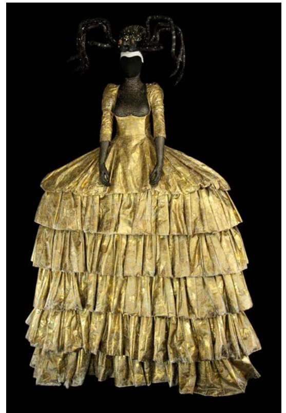
Costume d'Andrea Futterer-Schmidt pour la Reine dans Pereà, l'homme de fumée , opéra de Pascal Dusapin; Opéra national de Paris, 2003. Coll. CNCS / dépôt de l'Opéra national de Paris

Le début du 20 e siècle marque un tournant avec les Ballets russes, qui favorisent une vision artistique homogène, où metteurs en scène, chorégraphes et peintres collaborent. Au milieu du siècle, les metteurs en scène prennent une place prépondérante, transformant le costume en un outil narratif au service de la dramaturgie. Les créateurs de costumes s'émancipent alors du décorateur pour travailler directement avec les metteurs en scène. Cette évolution s'accompagne d'une participation accrue des grands couturiers, permettant à de jeunes créateurs et plasticiens contemporains d'expérimenter la scène comme un terrain d'expression privilégié.