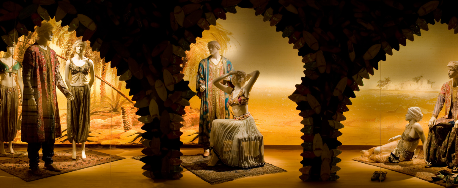
Exposition Mille et une nuits , 2008