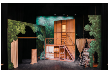
La Scène