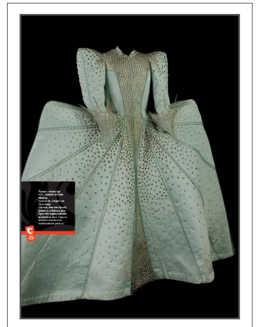
Exemples de panneaux photos de l'exposition

Ouvert en 2006 à Moulins, le Centre national du costume de scène fête ses 10 ans en 2016.