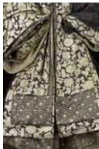
Costume pour le Comte de Northumberland par J.C. Barrera et N. Thomas, porté par M. Durozier dans Henri IV , mise en scène d'A.Mnouchkine, Théâtre du Soleil, Cartoucherie de Vincennes, 1984.

Des planches de costumes à porter en s'amusant des dessus-dessous, des masculin-féminin, des devant-derrière et des hauts et des bas ! Lignes du costume à dessiner, annoter, mettre en forme et décorer.