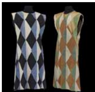
Costume de soldats par A. Samazeuilh et H. Lebrun dans Henry IV d'Angleterre , Festival d'Avignon, Théâtre national populaire 1950

Dans le théâtre de Shakespeare, les princes côtoient les mendiants et les fous, et la roue de la Fortune a tôt fait de transformer un roi en vagabond. Metteurs en scène et costumiers jouent en toute liberté avec cette diversité qui caractérise les tragédies et les comédies de Shakespeare. Deux costumes pour le même personnage illustrent cette liberté, en interprétant différemment la recherche maladroite d'élégance de l'une des Commères de Windsor, mistress Quickly :