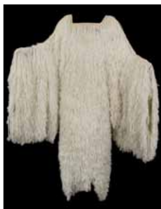
Costume de Titania dans Le Songe d'une nuit d'été , mise en scène, scénographie et costumes de Y. Kokkos, Nanterre, Théâtre des Amandiers, 2002. Coll. Théâtre des Amandiers

On verra notamment une robe aux paniers démesurés portée par Lady Macbeth et créée par Thierry Mugler pour une mise en scène de Jean-Pierre Vincent, qui a défrayé la chronique lors de la première au Festival d'Avignon (1985).