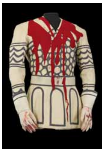
Costume pour le Spectre de Banquo par M. Prasinos dans Macbeth , Festival d'Avignon, Théâtre national populaire, 1954. Coll. Maison Jean Vilar

« Installée à Avignon, la Maison Jean Vilar conserve un fonds exceptionnel de maquettes et de costumes ayant appartenu à la "légende" du Festival d'Avignon et du Théâtre National Populaire sous la direction de Jean Vilar. Par leur qualité graphique et leur simplicité de fabrication, ces costumes témoignent du souci constant d'offrir les plus grandes œuvres au plus large public, sans surcharge ni prétention décorative. Clarté des signes,