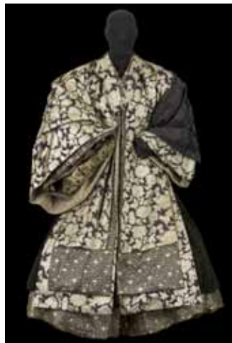
Costume pour le Comte de Northumberland par J.-C. Barriera et N. Thomas, porté par M. Durozier dans Henry IV , mise en scène d'A. Mnouchkine, Théâtre du Soleil, Cartoucherie de Vincennes, 1984. Coll. BnF

De 1981 à 1984, le cycle des « Shakespeare » au Théâtre du Soleil succède à celui des créations collectives représentant l'Histoire et la société françaises. Des six pièces prévues à l'origine, quatre seront finalement créées, Richard II , La Nuit des rois et les deux parties d' Henry IV « Chronique d'une tribu de personnages qui luttent pour construire le monde », les Shakespeare nécessitent une grande forme scénique, qui est recherchée dans le théâtre