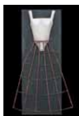
Costumes sur panneaux en bois par V. Merlin pour La Mégère apprivoisée , mise en scène O. Korsunovas, Comédie-Française, 2007.