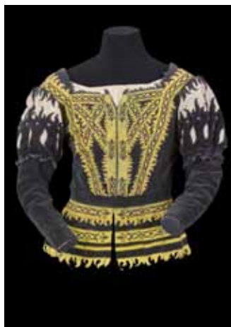
Costume de Roméo par G. Wakhevitch pour Roméo et Juliette, composition de S. Prokofiev, mise en scène et chorégraphie de S. Lifar, Opéra national de Paris, 1955.

Les grands couples shakespeariens et leur histoire tragique sont dans toutes les mémoires. Roméo et Juliette, Othello et Desdémone, Vérone et Venise, nous habitent depuis quatre siècles de la scène à l'écran, de la parole au chant, du bal des Capulet de Shakespeare à la Danse des chevaliers de Prokofiev. À découvrir dans cette salle, une robe de Juliette par Jean Hugo dans la mise en scène de Jean Cocteau, réalisée en velours peint de motifs de dentelle qui se révèlent à la lumière noire.